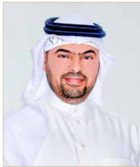
الشيخ مشعل بن محمد

صرح الوكيل المساعد لمشاريع البناء والصيانة بوزارة الأشغال وشؤون البلديات والتخطيط العمراني الشيخ مشعل بن محمد آل خليفة بأنه سيتم البدء بأعمال مشروع أعمال التطوير والتوسعة بمركز بلاد القديم الصحي قريبا، حيث إن الوزارة في مراحل استكمال الإجراءات للمشروع.