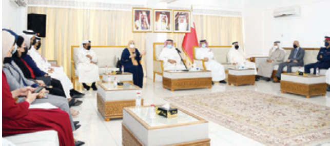
○ اللقاء الأسبوعي لمحافظ المحرق مع الأهالي.

هو المعيار الأبرز في الوصول إلى إعلان اختيار منطقتي البستين والساية مدينة صحية. واختتمت مسيرة إدارة تعزيز الصحة بوزارة الصحة الدكتوروة وفاء الشريتي مداخلات الحضور بتأكيد أهمية توثيق الانجازات التي تحققت عبر السنوات الطبية والبنية التحتية التي تحظى بها المحرق بشكل عام، مشيدة بتعاون كافة مؤسسات القطاعين العام والخاص ومؤسسات المجتمع المدني.